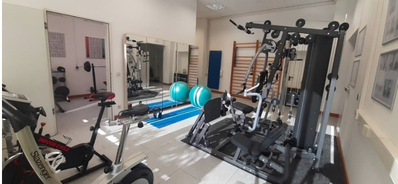
Abb. 5: „KRAFTwerk“, das neue Fitness- und Gesundheitsstudio der BSG

BSG (Abb. 5). Hier wird ein effizientes und individuell gestaltetes gerätegestütztes Kraft- und Kraftausdauertraining mit den beiden Schwerpunkten Fitness und Kraftsport sowie Gesundheits- und Präventionssport angeboten.